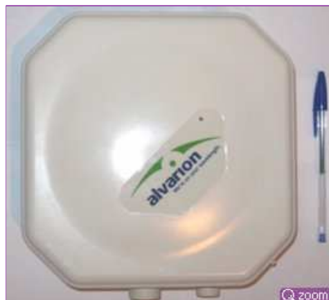
WiMax - Antenne abonné

Donner accès à tous les Bourguignons à un Internet de qualité : c'est l'objectif du programme Bourgogne haut débit, porté par la Région Bourgogne, en cours de réalisation.